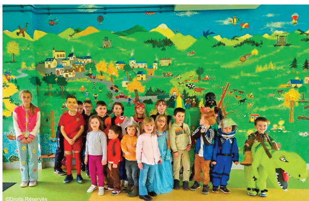
Les enfants du centre de loisirs lors du carnaval

Du 6 juillet au 28 août 2026, l'accueil de loisirs "Les Graines de Gentiane" propose un programme très éclectique pour les enfants. Des jeux de raquettes, aux animaux en origami, en passant par la création d'un bateau géant, les enfants auront de quoi s'occuper tout l'été en compagnie des éducateurs de l'accueil de loisirs.