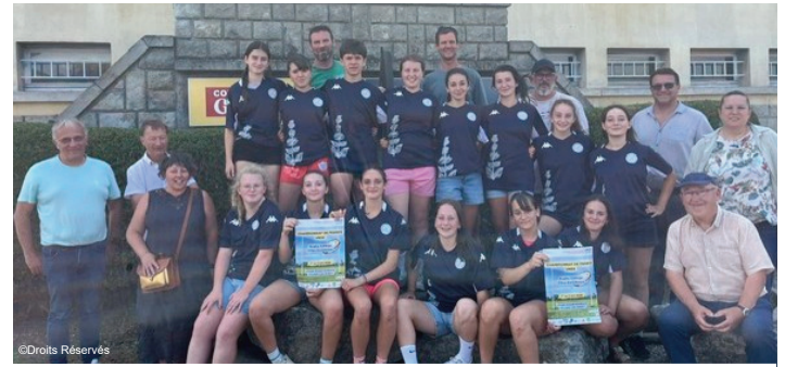
Une belle performance des collégiennes au niveau national

Cette performance mérite d'autant plus d'être saluée que le collège Georges Bataille compte seulement 146 élèves, quand plusieurs établissements concurrents regroupent entre 500 et 1 000 élèves. Face à des structures bien plus importantes, les