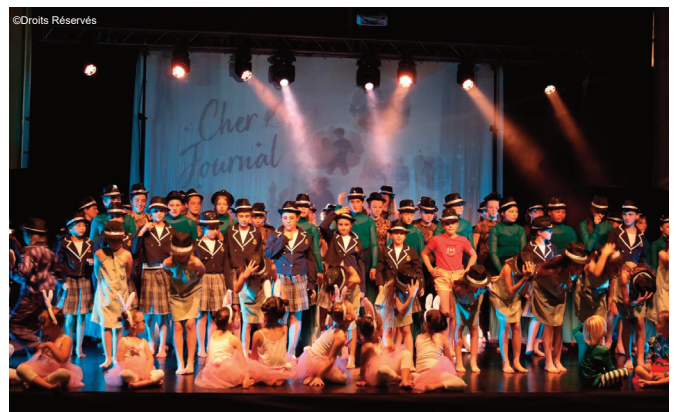
Les enfants de l'association R'Dance lors de leur performance