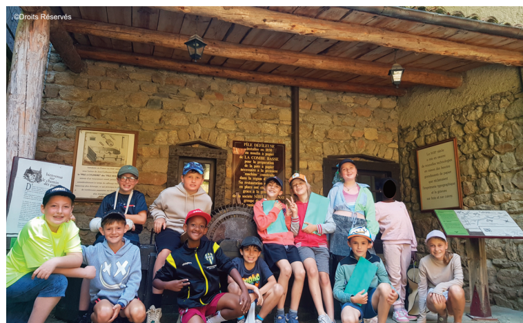
Les élèves au moulin Richard de Bas

Cette belle journée, alliant patrimoine, artisanat et découverte des ressources naturelles, a permis aux élèves d'enrichir leurs connaissances tout en vivant des expériences concrètes et enrichissantes.