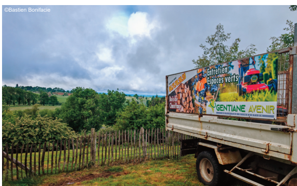
Gentiane Avenir propose de nombreux services

Pour tout renseignement ou demande d'intervention, contactez Gentiane Avenir au 04 71 78 03 39.