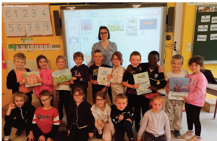
Les petits découvrent la richesse de la littérature jeunesse

L'équipe enseignante se félicite de l'enthousiasme suscité par cette opération, qui continue de transmettre aux élèves le plaisir de lire et de découvrir de nouvelles histoires.