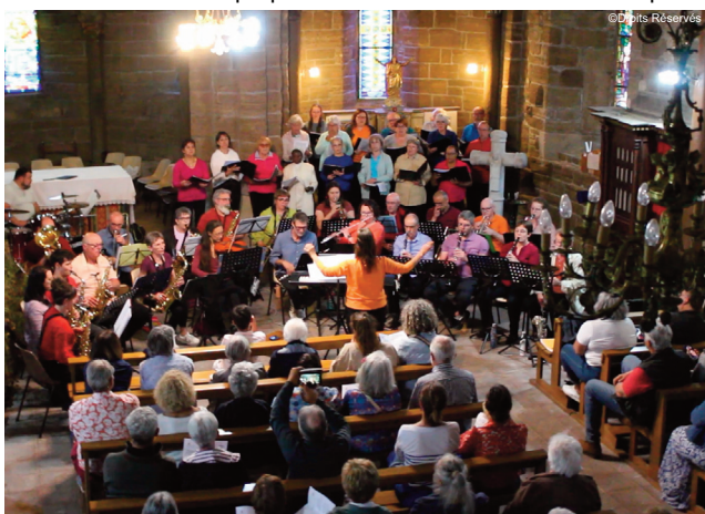
Un concert qui a rassemblé dans l'église de St Amandin

Un mélange qui semble avoir comblé le public venu nombreux. Pour le prouver, aucune place n'a été laissée libre sur les bancs de l'église ! Preuve que ce genre de proposition culturelle est demandée sur notre territoire.