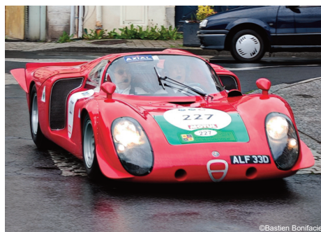
Alfa Romeo T33/2 / 1968

Ce passage du Tour Auto a offert un beau moment d'animation sur notre territoire, mettant en valeur aussi bien les véhicules historiques que les routes du Pays Gentiane.