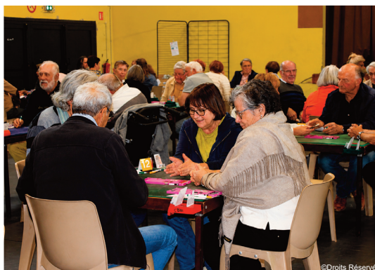
Le festival du bridge a rencontré un grand succès