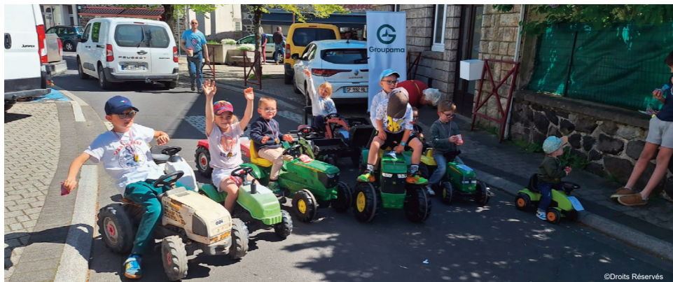
Plusieurs participants de la course de tracteurs

Durant la Seconde Guerre mondiale, Rosa est recrutée comme "gouteuse" pour Adolf Hitler. Trois fois par jour, chaque bouchée sera peut-être la dernière.... V.O.S.T. Durée 2h03.