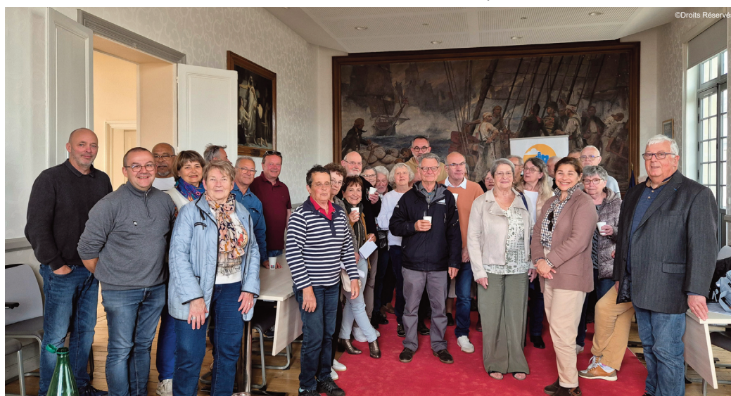
Fourasians et riomois ont passé un très bon week-end rempli par de nombreuses activités

Dimanche matin, les participants ont découvert les marchés couverts de Fouras-les-Bains, notamment celui des poissons et des huîtres,