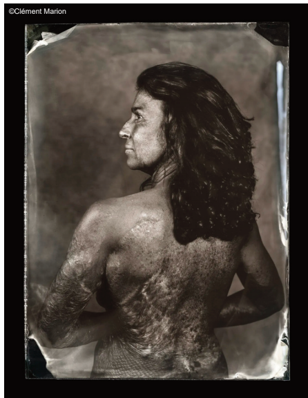
Pièce de la série photographique « Phoenix » sur les cicatrices aussi bien externes qu'internes de grands brûlés

À Riom-ès-Montagnes, Clément Marion développera le projet LITH (titre provisoire) durant lequel le procédé de tirage Lith sera utilisé. Ce procédé argentique rare et expressif est un processus long où l'image se révèle lentement par oxydation. Ce processus doit être interrompu à un moment précis, sous peine de voir le papier s'assombrir entièrement faisant ainsi disparaître la photographie. Cette tension permanente fait écho à la sclérose en plaque, une maladie évolutive parfois silencieuse, et met en lumière à la fois la fragilité, la force et la singularité de chaque corps photographié. Les personnes photographiées sont mises en scène avec douceur, sur des fonds textiles unifiés, afin de donner à voir ce qui reste souvent