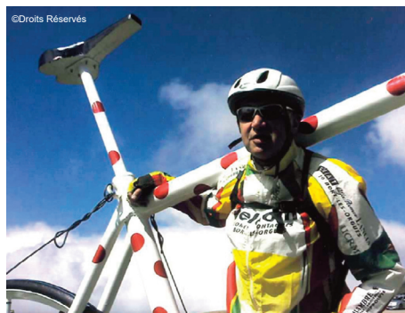
Ascension du Tourmalet - 2007