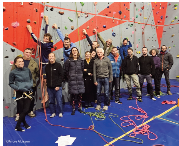
Une association d'escalade en pleine forme

Le mode d'organisation de l'an passé devenait en effet difficile à assurer face à l'augmentation du nombre de participants. Ainsi, le club a décidé d'employer un moniteur d'escalade sur 24 mercredis par an. Les six autres mercredis seront pris en charge par les initiateurs du club. Les cours adultes se dérouleront toujours les lundis