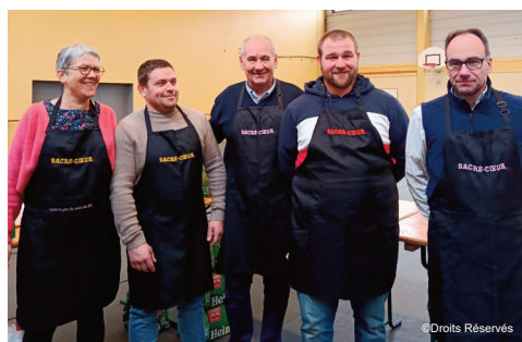
Les parents d'élèves ont revêtu leurs tabliers

Entre deux parties, les participants ont pu se restaurer à la buvette grâce aux pâtisseries préparées par les parents d'élèves. Les bénéfices