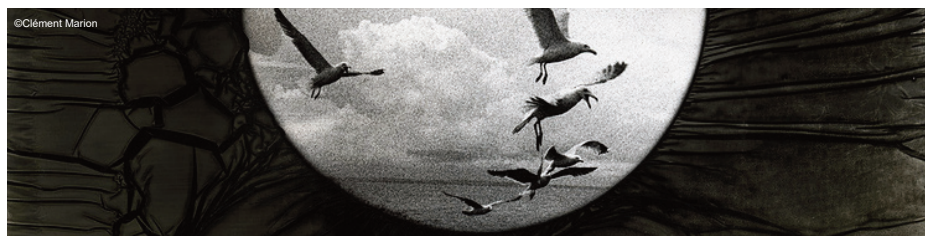
Pièce de la série photographique « Potentiel Emotions »

À travers ce projet, il réaffirme sa conviction que l'art et l'image peuvent créer du lien, ouvrir des espaces de dialogue et donner une place sensible à des vécus souvent invisibles.