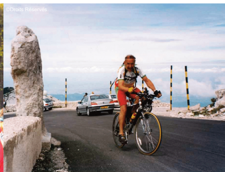
Ascension du mont Ventoux - 2004