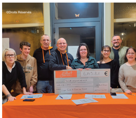
Plus de 6149 euros de dons collectés en 2025 !

De nombreuses animations ont également été très réussies en 2025 et l'association aimerait les réitérer.