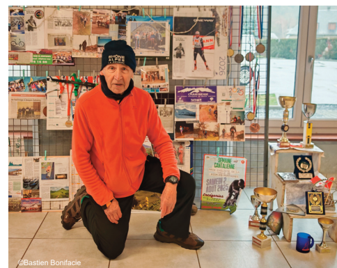
Exposition-Rencontre - 2026