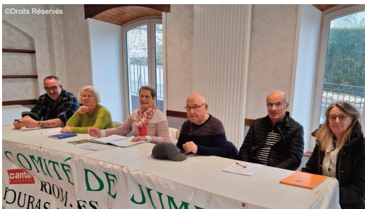
Les éco-délégués en visioconférence

En décembre, le comité s'est également mobilisé pour le Téléthon avec une vente de gaufres qui a permis de