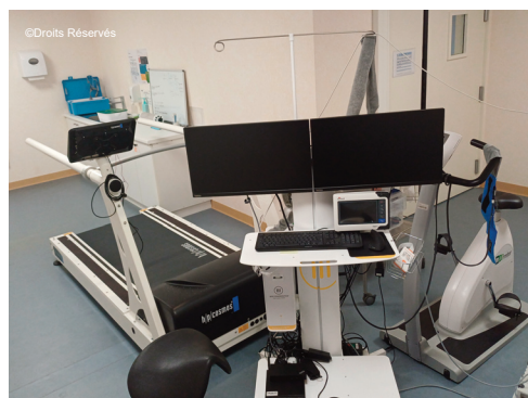
La clinique du Souffle s'équipe d'un tapis roulant inclinable