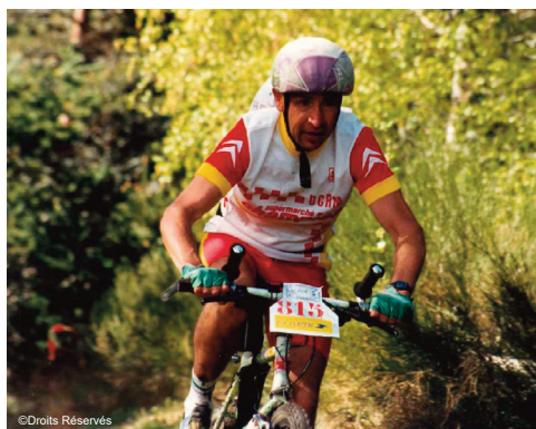
Sur les Pas de la Bête - 1992

Avec le but de transmettre son expérience et de partager de nombreux témoignages de son parcours, cet évènement c’est conclu par un pot de l’amitié.