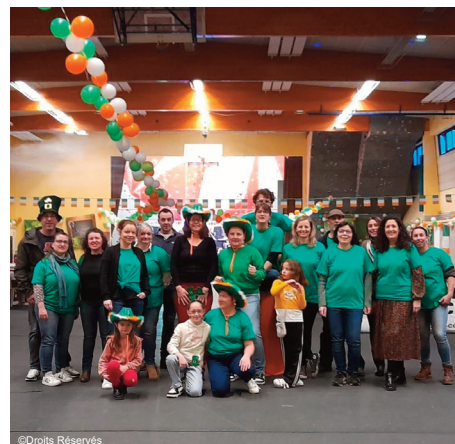
En 2025, la saint Patrick a été une réussite

Les réservations se feront via la plate-forme helloasso ou via SMS au 06 75 72 26 93 avant le 03 mars 2026.