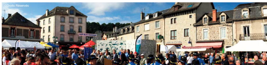
Beaucoup de public pour cette 27ème édition de la fête du bleu d'Auvergne

L'aventure continue et reste ouverte à toutes celles et ceux qui souhaitent rejoindre l'équipe de bénévoles.