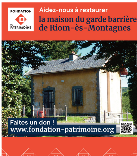
Affiche d'appel au don pour la restauration de la maison du garde-barrière de Riom-ès-Montagnes

Propriétaire du bâtiment, la commune mène ce projet en partenariat avec l'Association des Chemins de Fer de la Haute Auvergne, exploitante du Gentiane Express depuis 1993. Inscrite dans les dispositifs Petites Villes de Demain et Opération de Revitalisation du Territoire, cette rénovation est identifiée comme une action prioritaire pour renforcer l'attractivité de l'entrée nord du bourg. Après des travaux qui vont débuter en janvier 2026, le rez-de-chaussée accueillera un espace d'exposition gratuit dédié au patrimoine ferroviaire, tandis que l'étage servira