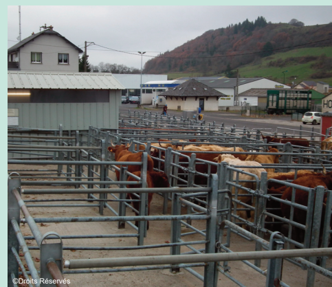
Question du réaménagement du foirail

Dans l'attente du versement des subventions pour les projets d'investissements, le conseil municipal a décidé d'ouvrir une ligne de trésorerie sur 12 mois jusqu'à 500 000€ (déblocage en fonction des besoins).