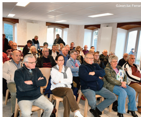
De nombreux membres de l'association présents

L'association tient à souligner que la trésorerie est stable malgré le non versement de la subvention habituelle du conseil départemental.