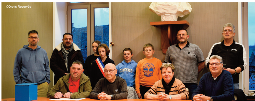
Le conseil municipal des jeunes entouré de plusieurs élus.

mandat de trois ans au sein du conseil municipal des jeunes. Durant ce mandat, ils auront pour mission de porter la parole des jeunes de la commune, de proposer des initiatives, et de participer activement à la vie locale en collaboration avec les élus municipaux.