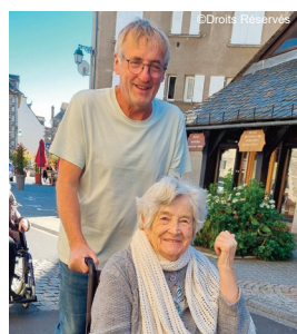
Un beau moment de partage

37 résidents ont pu déambuler dans les rues, entourés par les participants heureux de pouvoir partager un moment privilégié à l'extérieur.