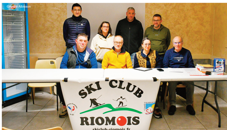
Une année réussie pour le ski club riomois

Le président du club a tenu à saluer l'engagement indispensable des bénévoles, des moniteurs fédéraux et des accompagnants, ainsi que le soutien de l'ESF, de la Régie du Super Lioran et des collectivités locales. La commune de Riom-ès-Montagnes et le Conseil départemental ont notamment été remerciés pour leur aide financière, essentielle au fonctionnement du club et au maintien de tarifs accessibles pour les familles. Il a d'ailleurs été rappelé que les cotisations versées par les parents ne couvrent pas l'intégralité du coût réel des cours ESF, une part restant à la charge du club grâce aux