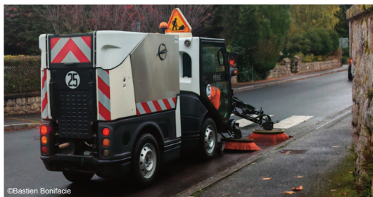
La nouvelle balayeuse de voirie est sur les routes

La balayeuse municipale parcourt les rues de Riom-ès-Montagnes depuis le début du mois de novembre. Vous l'avez peut-être aperçue dans les rues de Riom-ès-Montagnes ces derniers jours, la nouvelle balayeuse municipale est arrivée en ville. Ce véhicule devrait