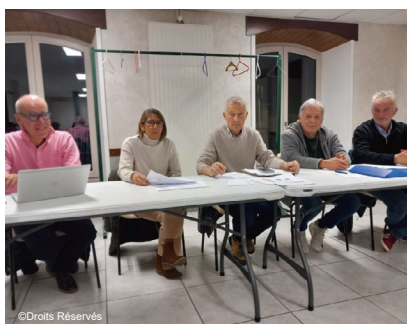
Peu de changements au sein du bureau du Riom Gentiane Tennis Club

L'association rappelle également que la compétition n'est