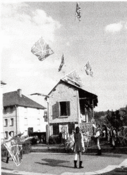
Les lanceurs de drapeaux Italiens

grand nombre de spectateurs rassemblés pour assister au spectacle. Malgré les contraintes liées à la sécheresse, toutes les mesures de sécurité ont été prises pour qu'aucun n'incident n'arrive. Le spectacle fut d'une telle qualité que toutes les personnes présentes n'ont cessé d'applaudir. Le Comité des Fêtes, présidé par Francette Belmont, a encore su faire des prouesses, pour offrir aux Riomois et aux estivants des défilés et une animation de qualité, comme en témoignent les nom-