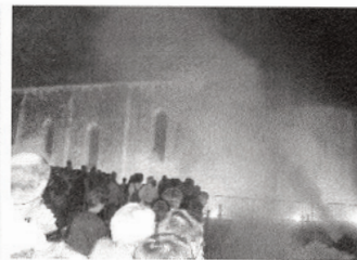
Le spectacle laser avec l'embrasement de la mairie et de l'église a attiré un public nombreux.