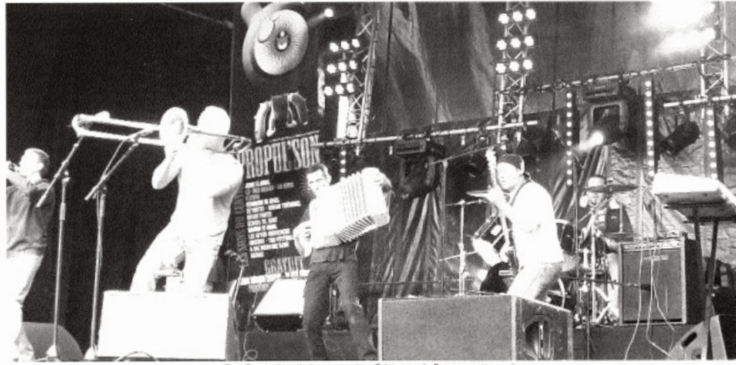
Tout Sourire lors de leur concert au Printemps de Bourges cette année.

Organisée par le comité des fêtes conjointement avec la Mairie de Riom-ès-Montagnes, la fête de la Jeunesse et de la Rosière a lieu les 7 et 8 août prochains. Brass-Band et majorettes venus tout droit de Croatie, le groupe rock Tout Sourire, une course cycliste ponctueront cette traditionnelle fête qui connaîtra un autre moment fort, celui du couronnement de la Rosière. A noter que cette fête tendra au cours des prochaines années à développer les animations à destination des jeunes, toujours avides de festivités !