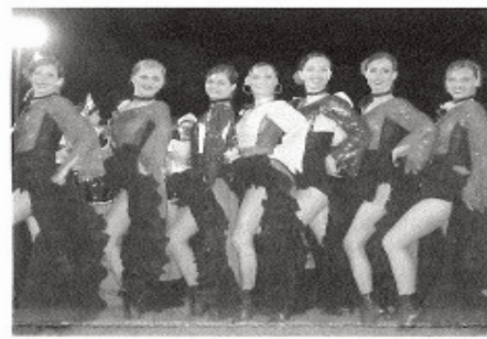
L'ensemble slovaque Witches

Cet événement estival à Riom-ès-Montagnes est organisé par le comité des fêtes. L'ensemble des spectacles et animations proposés est gratuit. Cette année, les festivités débuteront en musique avec la fanfare slovaque et les majorettes Witches qui effectueront un concert le samedi à 21h, place de la mairie.