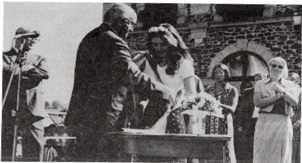
La Fête de la Rosière, une célébration de la jeunesse

P.d.R. : Que pourront-ils, eux, retirer de leur passage chez nous ?