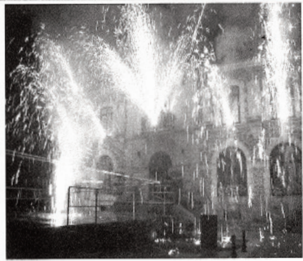
L'embrasement de l'Hôtel de Ville, un moment magique pour les yeux

À 17 heures Place de l'Hôtel de Ville, l'association "Riom Gentiane Delco Riomois" est venue avec ses véhicules de collection proposer à la Rosière et ses demoiselles d'honneur une balade dans les rues de la cité. Puis, les festivités ont repris de plus belle, grâce à un concert place de l'Hôtel de Ville. Le soir, un peu plus au frais, un autre défilé dans les rues a eu lieu, précédant l'embrasement de l'Hôtel de Ville et de l'Eglise, suivi d'un spectacle laser qui a su émerveiller un