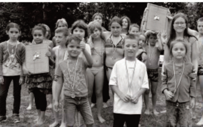
Les courageux participants aux challenge enfants sur structures gonflables