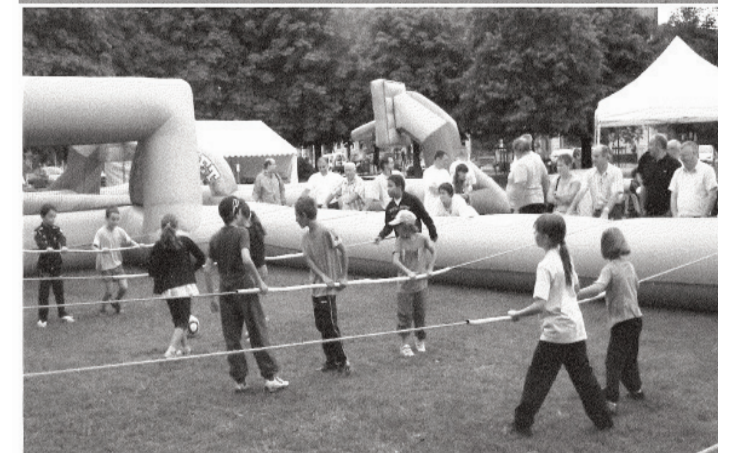
De nombreux jeunes se sont retrouvés lors des défis sportifs, place du Monument. Grosse ambiance !

La Rosière 2011, symbole de la jeunesse riomoise !