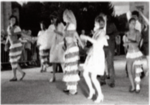
Les danseurs de C pl Douvan infatigables et ses amis aux danses martiniquaises

du rock : de U2 à Noir Désir en passant par Téléphone ou encore Muse.