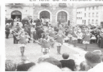
Le couronnement aura lieu place de la Mairie.