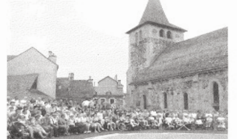
La fête de la Rosière, un événement suivi par beaucoup, ici lors de la fête en 2004.

Une nouveauté qui fera certainement plaisir à de nombreux spectateurs : cette année, le comité des fêtes propose un concert de rock le dimanche soir, place de la mairie à 21h. Les groupes "Roots Harmonik" et "AC/DçU" auront à coeur de conclure la fête de la Jeunesse et du Tourisme par leur musique enflammée !