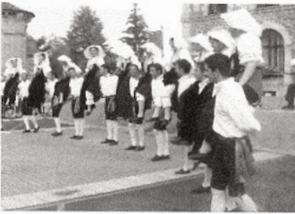
Les groupes d'Italie et de Bulgarie ont offert un magnifique spectacle de folklore.