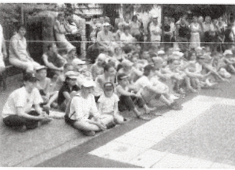
Tous les ans la colonie "Sport et montagne" s'installe à Riom-ès-Montagnes et propose des démonstrations de twirling aux habitants. Leur passage à la fête de la Rosière et de la jeunesse a été remarqué et apprécié du