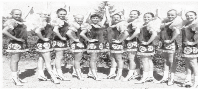
Le Brass Band Pradoun animera les rues pendant la fête.