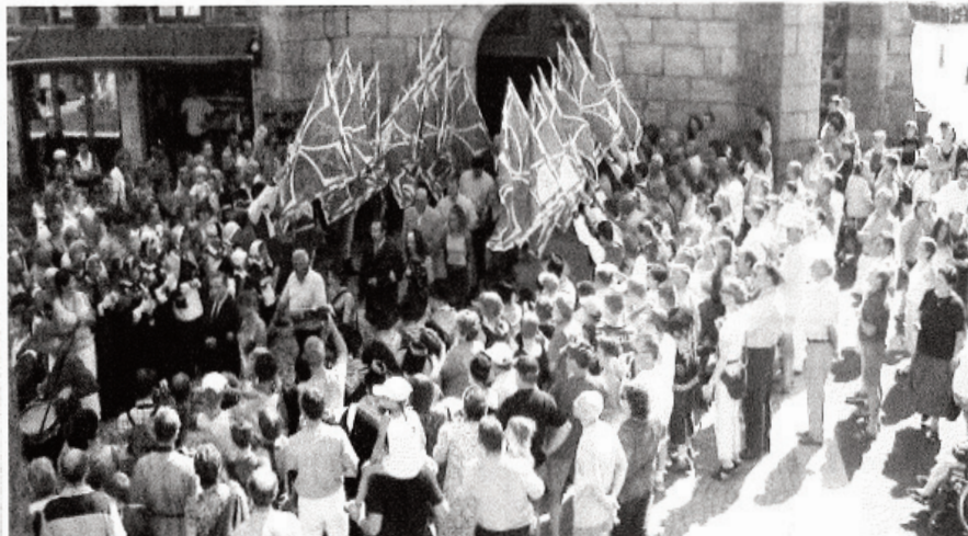
La sortie de l'Eglise Saint-Georges a été un moment fort apprécié

breuses personnes qui se sont donné rendez vous tout au long de ce week-end dédié à la jeunesse. Les bénévoles du Comité des Fêtes vont continuer sur leur lancée ce week-end avec la 6ème édition de la Fête du Bleu d'Auvergne.