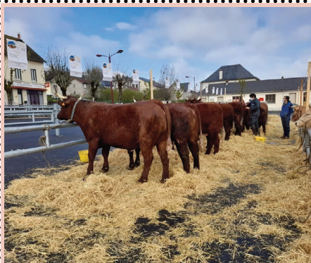
La Foire du gras sera de retour le 28 avril.

La 4e édition de la Foire du gras se tiendra le dimanche 28 avril prochain au foirail de Riom-ès-Montagnes.