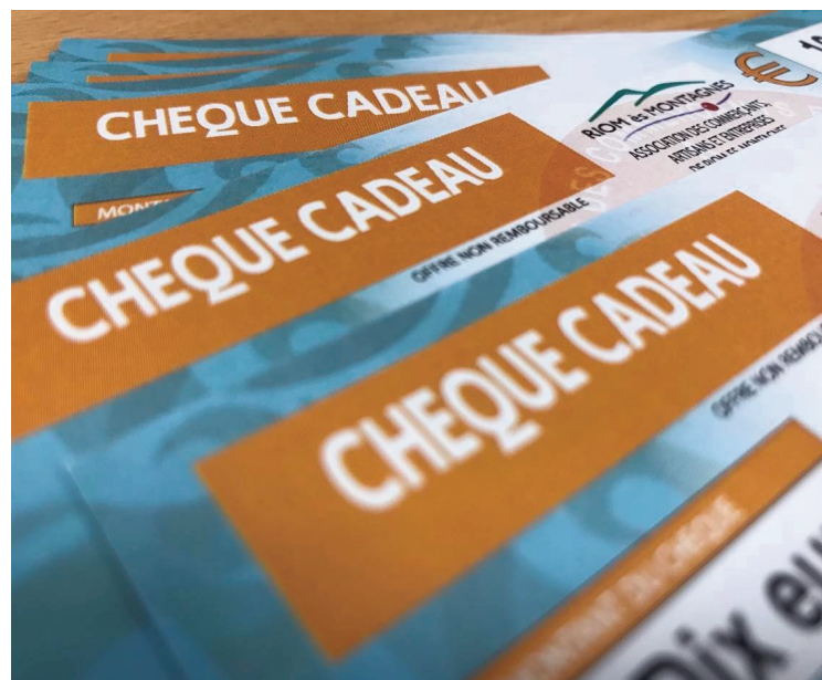
Trois jours sont banalisés pour retirer ces chèques et les bénéficiaires sont priés de respecter ces permanences.

Ces chèques seront à retirer lors de trois matinées de permanences lundi 11 décembre, mercredi 13 décembre et vendredi 15 décembre , de 9 heures à 12 heures en salle du sous-sol de la mairie. Il est impératif qu'un maximum de personnes viennent retirer ses chèques lors de ces trois jours de permanences, pour faciliter l'organisation des services de la mairie. Les personnes qui ne viendront pas lors de ces jours de perma-