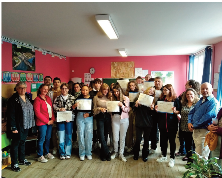
Les anciens élèves de 3e du Sacré-Coeur ont reçu leur diplôme.

La cérémonie de remise de diplômes du brevet s'est tenue le 21 octobre dernier au Sacré Coeur. Une belle promotion d'élèves avec 100 % de réussite à l'examen, a été félicitée, de même que leurs professeurs.