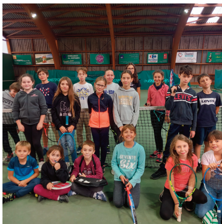
70 jeunes et adultes prennent des cours.