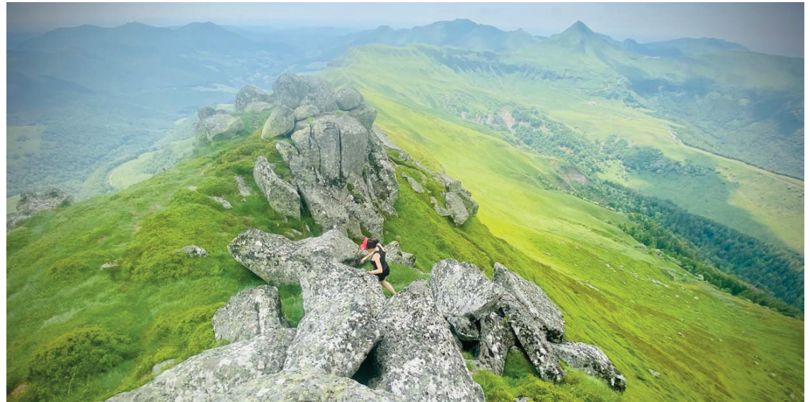
Les professionnels saluent une meilleure visibilité de la destination Cantal mais aussi de l'Office de tourisme Destination Haut Cantal.

Entre les mois de juillet et août, 145 000 nuitées ont été comptabilisées sur le territoire, avec des