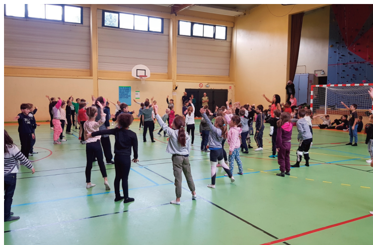
La Caravane Kids s'est installée sur le territoire pour intervenir auprès des élèves de Pompidou.

Parmi cette programmation, le festival Jour de danse(s) a déjà amené la "Caravane Kids" dans les écoles du territoire et notamment celle de Riom. Cette caravane, du Centre National