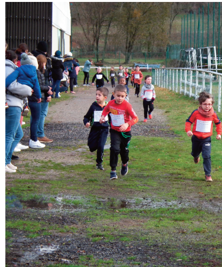
Les élèves ont parcouru différentes distances selon leur niveau.

Il s'agissait d'un cross solidaire car les élèves ont pu faire don d'un ou de plusieurs objets, jeux, jouets ou livres, à l'association Les Pères Noël Verts, du Secours Populaire Français. La Fédération du Cantal du Secours Populaire Français, en partenariat avec une grande sur-