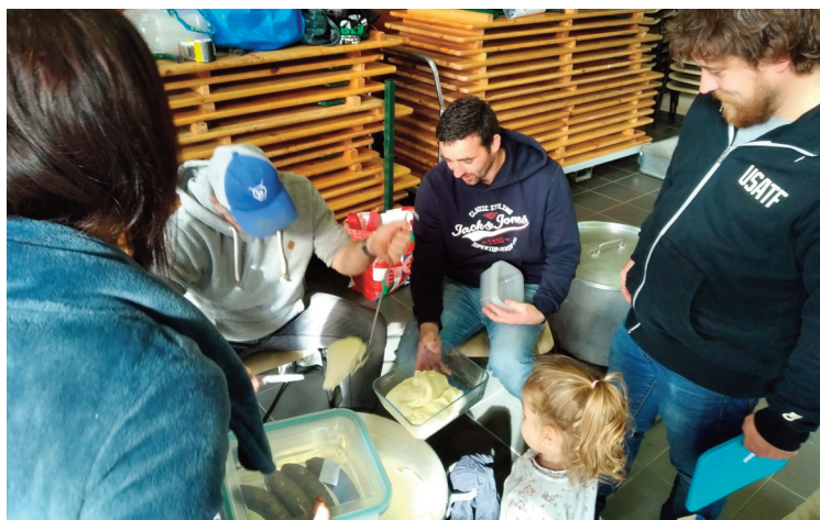
Les 200 commandes ont été atteintes.

L'école du Sacré Coeur c'est une équipe motivée, un APEL et un OGEC qui travaillent de concert pour offrir le meilleur aux élèves et à leurs familles.