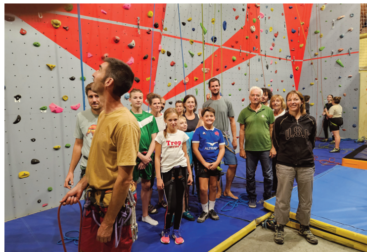
Les séances pour tous se tiennent le lundi de 17h à 21h.

Lors de sa journée portes ouvertes, le 10 septembre dernier, le club a