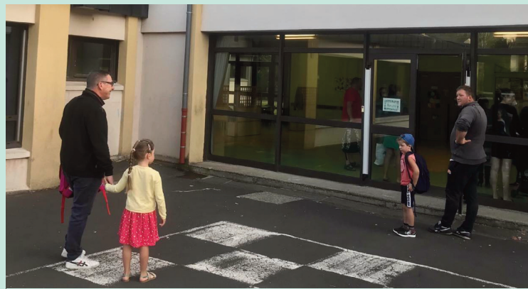
Les élus ont lancé le projet de rénovation énergétique de l'école Pompidou et ont sollicité les subventions nécessaires.

À l'unanimité des membres présents, le conseil municipal a décidé d'approuver le lancement de l'opération de travaux de rénovation énergétique de l'École élémentaire G. Pompidou, d'adopter le montant prévisionnel des travaux estimé à 828 888 € HT et de solliciter auprès de l'État une subvention DETR et DSIL 2024 concernant cette opération.