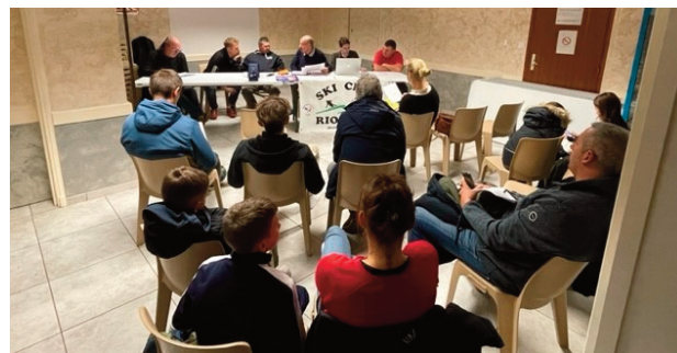
Le Ski club a tenu son assemblée générale.

Au total, ce sont 22 sorties qui ont été effectuées. Hormis les sorties ski des mercredis et samedi, le Ski club a aussi organisé un week-end à La