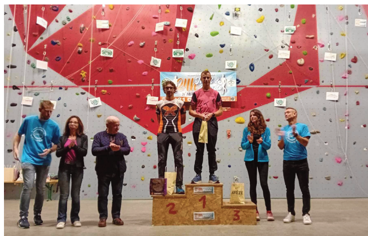
Le vainqueur du challenge a, à lui seul, effectué 18 boucles.

Les 20 et 21 octobre dernier, pendant 24 heures, ce sont 1 010 boucles qui ont été effectuées par les traileurs et randonneurs participants. Là aussi, le record a été battu par rapport à l'an