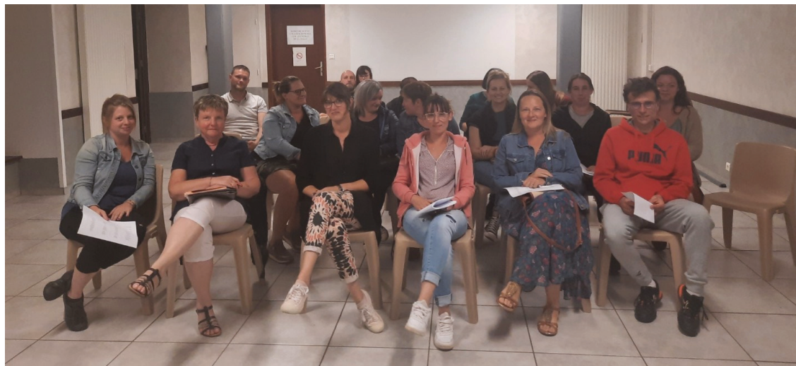
Le bureau s'est renouvelé et une nouvelle présidente a été élue (deuxième à droite sur la photo).

L'Amicale laïque du groupe scolaire Pompidou, réunie en assemblée générale, a renouvelé son bureau. Une nouvelle présidente a été élue et l'association prépare déjà ses prochaines manifestations.