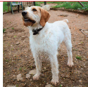
Les visiteurs pourront rencontrer Izidore, un chien à l'adoption.