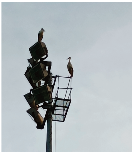
Un groupe de cigognes s'est arrêté au stade.

Il y a des rencontres quelque fois inattendues. C'est l'une d'elle qui a attiré l'oeil et l'objectif d'un Riomois, qui, en promenant son chien au lever du jour, a croisé la route d'un groupe de cigognes, qui avait élu domicile... Sur les projecteurs du Pré-Bijou ! Même si cette rencontre n'est pas banale, elle n'est pas non plus inhabituelle dans la région. En effet, elles sont souvent présentes dans le Cantal, qui compte quelques lacs et se trouve sur leur chemin migratoire, même si leur population est toutefois moins nombreuse chez nous qu'en Charente-Maritime, ou en Alsace par exemple.