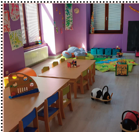
Le Relais Petite Enfance propose des ateliers d'éveil.

Le Relais Petite Enfance (RPE) poursuit ses ateliers d'éveil ouverts aux enfants de 0 à 6 ans accompagnés d'un adulte, de 10 heures à 11h30, dans une salle du rez-de-chaussée