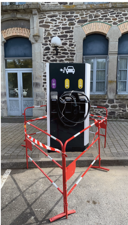
Une borne de recharge a été installée.

Une borne de recharge pour voiture électrique a été installée, place du monument. Celle-ci devrait être mise en service prochainement.