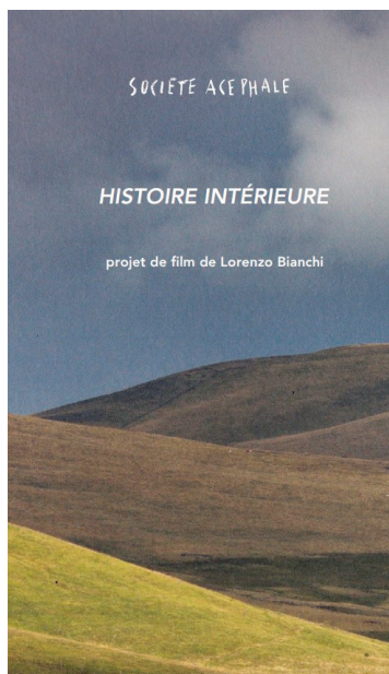
Le film Histoire Intérieure de Lorenzo Bianchi, sera tourné à Riom.

Un film, vu comme une continuité, une suite de son précédent film, Le Petit , également tourné à Riom, où il était question de faire face à la perte pour aller de l'avant. Dans Histoire Intérieure , cette question revient hanter les personnages, qui ont grandi et évolué. Le scénario ? Les rêves d'une mère et de son fils adolescent se croisent, faisant ressortir des blessures enfouies... Une histoire où il est question de séparation, thématique chère dans les intentions du réalisa-