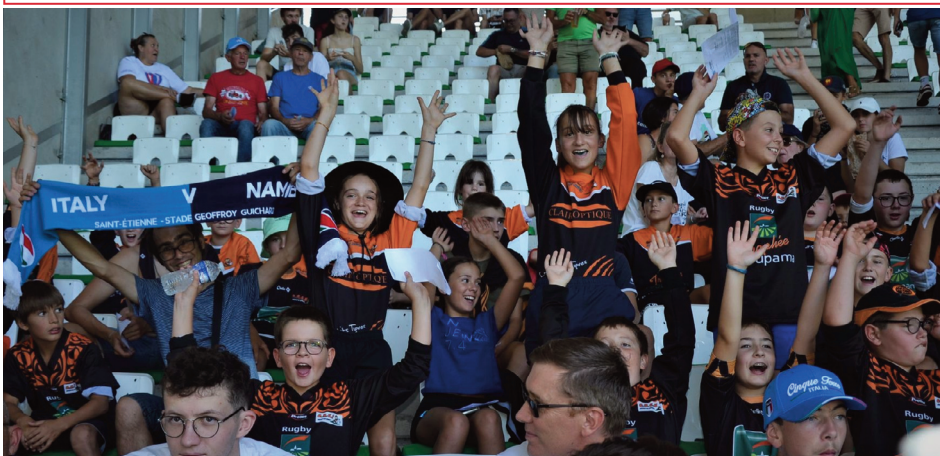
Vêtus du maillot de Riom, les jeunes ont enflammé les tribunes du stade Geoffroy Guichard de Saint-Etienne.

Les jeunes de l'école de rugby de l'ORCR ont eu la chance d'assister au match Italie-Namibie en Coupe du monde. Un moment inoubliable, qu'ils ont vécu en orange et noir, portant un peu de Riom au sommet du rugby mondial.