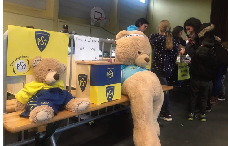
Challenge à la fois sportif et caritatif, le 24h Trail récolte des fonds pour ASM SOS.

Le principe reste le même : à allure libre - marche ou course - et sur une durée totale de 24 heures, du vendredi 20 octobre à 20 heures, jusqu'au samedi 21 octobre à 20 heures, le but est de faire le