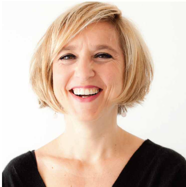
Valentine Goby sera accueillie à la bibliothèque mercredi 18 octobre.