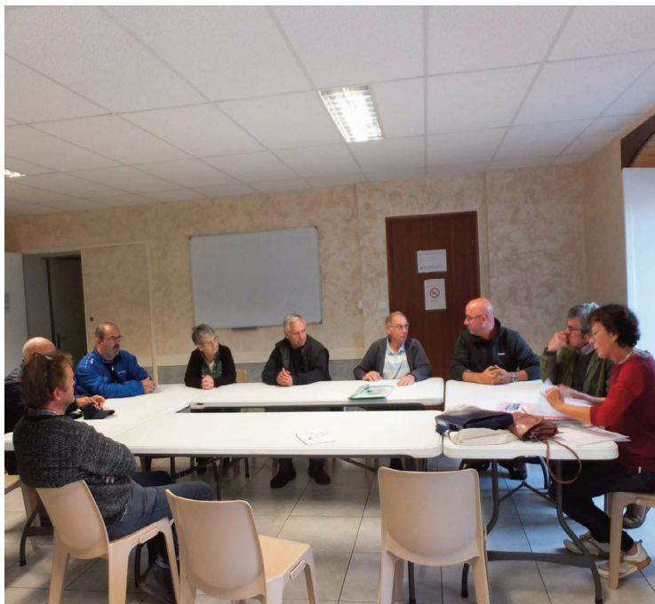
Après la démission du bureau, si aucun candidat à la reprise ne se présente, l'association sera mise en sommeil.