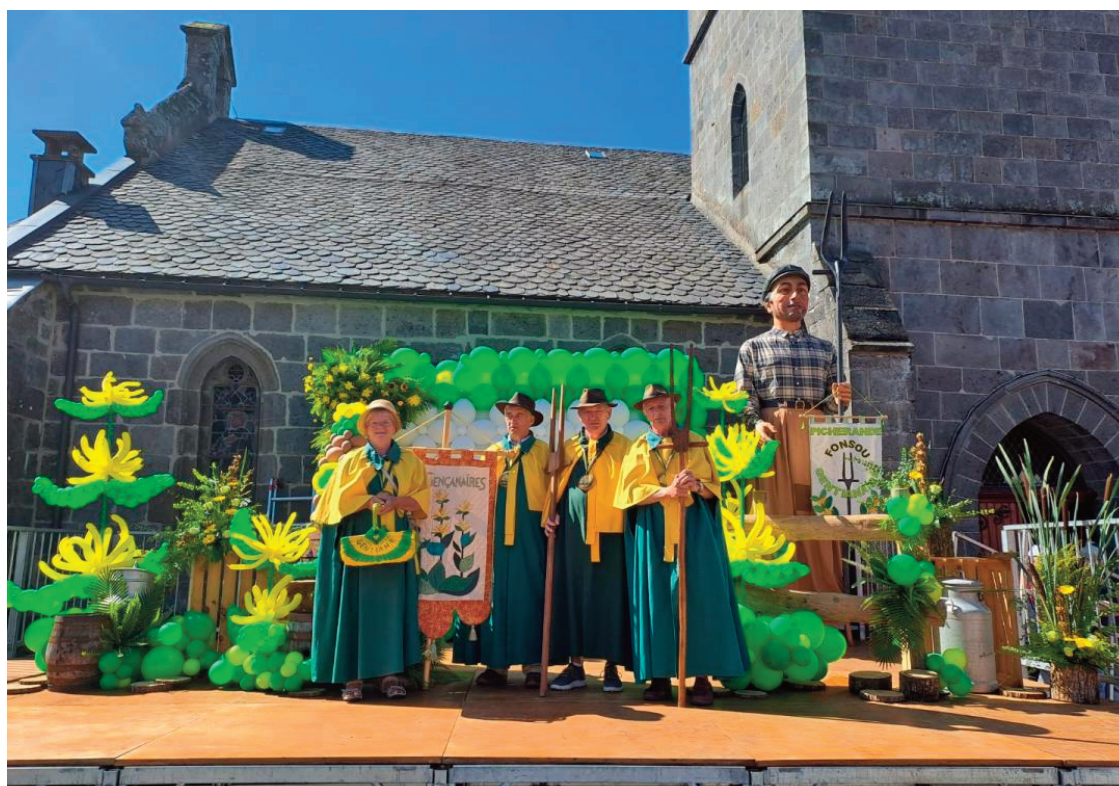
La confrérie était notamment présente à la Fête du Bleu d'Auvergne à Riom-ès-Montagnes.

Tout au long de la saison estivale, les membres de la confrérie « Les Gençanaïres » ont multiplié les prestations lors de différentes manifestations. La confrérie a participé deux fois au marché de pays à Condat et le Gentiane Express l'a sollicitée pour un train spécial gentiane. Très intéressés, les passagers ont posé de nombreuses questions sur cette plante emblématique du Pays Gentiane, sur la fleur et sur les racines. Une autre sortie a conduit le groupe à la fête de la Gentiane à Picherande (63) où de nombreux exposants étaient présents et ont proposé différentes boissons à base de Gentiane. Tout récemment, c'est à la fête du Bleu d'Auvergne à Riom, que les Gençanaïres étaient conviés et ont pu échanger avec les autres confréries invitées par Festibleu.