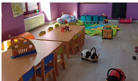
Les ateliers d'éveil ont repris au RPE.