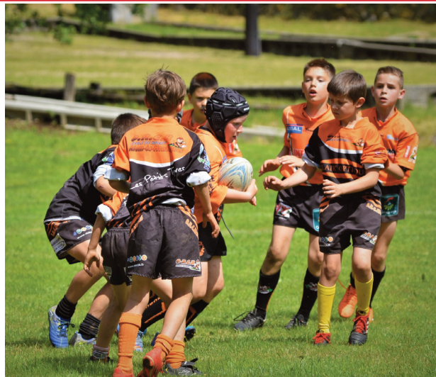
L'école de rugby est ouvert à tous les jeunes, nés entre 2010 et 2020, garçons ou filles.

L'école de rugby riomoise a par ailleurs renouvelé son