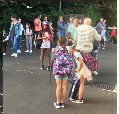
Dans la cour de l'école, les élèves de Georges Pompidou ont retrouvé camarades et professeurs.