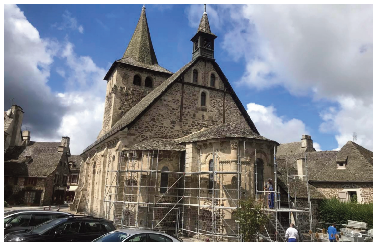
Le chantier de restauration de l'église a enfin débuté.

Il est notamment prévu une réfection complète des couvertures en lauzes de l'abside et du chevet, une restauration des parements extérieurs et intérieurs du chevet, ainsi que des vitraux de ses six baies, avec reprise des raquettes de protection, un nettoyage et une consolidation des éléments sculptés (corniche, modillons, chapiteaux, cordons), une réfection du revêtement de sol en pied de façade du chevet, de l'enduit du pignon