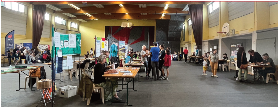
Les associations tenaient des stands, au gymnase municipal.

Le Forum des associations, qui s'est tenu samedi 2 septembre dernier, a réuni plus d'une vingtaine d'associations locales au gymnase municipal, pour renseigner les Riomois sur leurs différentes activités.