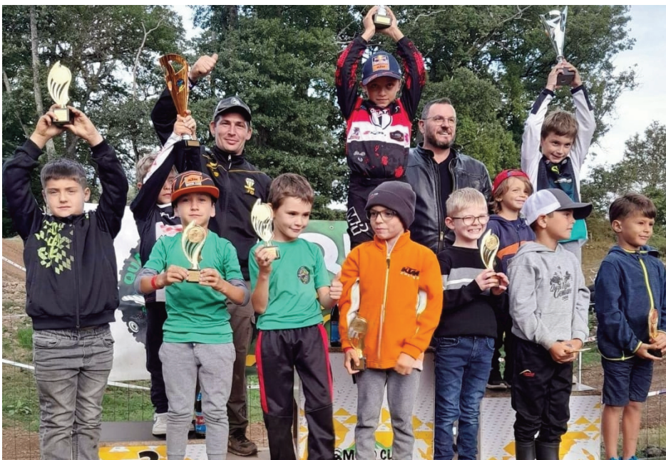
Les jeunes de la catégorie 50 cc lors de la remise des prix.

Le club Quad et Moto Gentianes a accueilli une nouvelle compétition de grande ampleur ce dimanche 27 août. Après les championnats de France Cross Country qui s'étaient tenus en mars dernier, le club rioinois organisait les master jeunes de la Ligue Auvergne-Rhône-Alpes motocross et le trophée du Cantal.