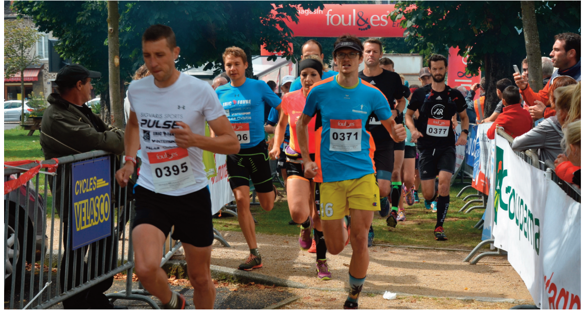
Cette année, un 28 km partira de Lugarde et traversera le village de course au Coudert, où le public pourra encourager les coureurs, qui prendront ensuite la direction de Majonenc.

Les habitués auront peut-être de quoi être chamboulés. Pour cette 9e édition du Trail des 6 Burons à Riom-ès-Montagnes, samedi 26 août, les courageux qui prendront le départ du 73 km auront droit à un circuit différent cette année. On prend pourtant les mêmes sommets que l'an dernier, mais on s'y attaque dans l'autre sens ! Le parcours prendra son départ à Riom direction Collandres et la Gayelle, puis le Puy de la Tourte. L'ascension du Puy Mary se fera ainsi par le pas de Peyrol et donc les maches, pour ensuite rattraper la brèche de Rolland, le Peyre Arse, le col de Cabre puis le Bataillouse et le Bec de l'Aigle. Retour ensuite par le col de Serre, la vallée de Lavigerie et le plateau du Limon. Au total : 3000 m de dénivelé positif. Rien que ça. Mais pas de panique, d'autres parcours, de plus courtes distances sont également proposés.