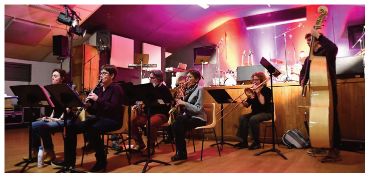
Si vous jouez d'un instrument à vent, des cuivres, percussions, cordes ou claviers, vous pouvez rejoindre l'orchestre.

L'orchestre est ouvert à toutes les personnes pratiquant un instrument (vents, cuivres, percussions, cordes, claviers...) quel que soit son âge et son niveau musical. Il compte à ce jour une quinzaine de musiciens de toutes