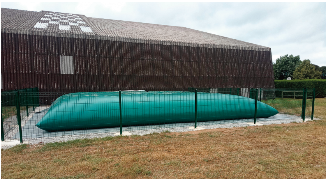
Une fois la piscine vidangée, l'eau servira notamment à l'arrosage des fleurs.

Une citerne souple de 100 m 3 a été installée par les services techniques de la mairie de Riom-ès-Montagnes pour récupérer les eaux de vidange de la piscine au printemps et à l'automne. Cette eau sera ainsi réutilisée pour l'arrosage des fleurs et des arbres.