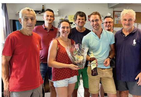
Après le tournoi estival, le RGTC prépare la rentrée.

L'édition 2023 du tournoi de tennis organisé par le Riom Gentiane Tennis Club (RGTC) s'est déroulée du 5 au 15 août à Riom-ès-Montagnes. Le RGTC a accueilli une cinquantaine de joueurs inscrits dans les différents tableaux préparés par le juge arbitre Gilles Coste.