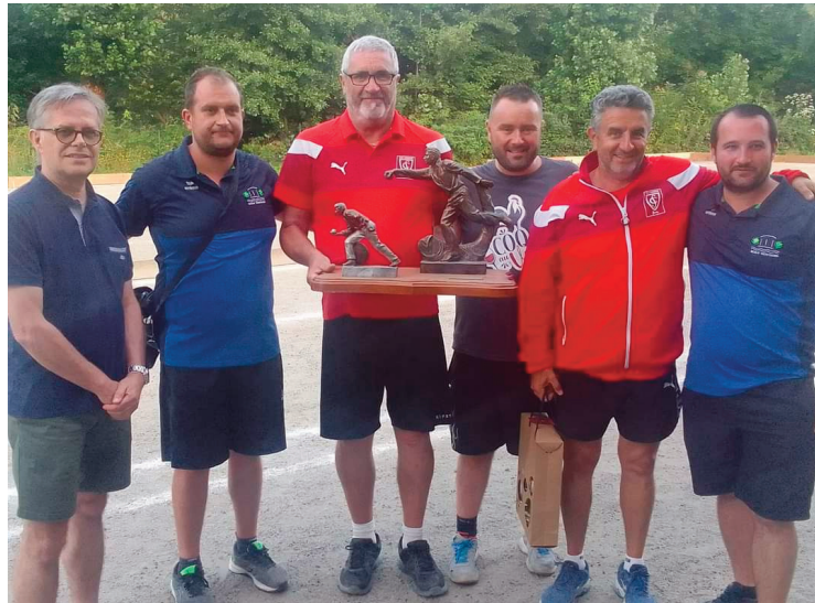
L'ABR a organisé deux journées de compétitions qui ont été bien disputées.