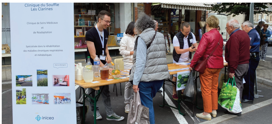
Sur le marché de Riom, des professionnels de santé ont proposé plusieurs petites activités aux passants.

Plusieurs professionnels de santé de la clinique du souffle étaient présents sur le marché pour sensibiliser sur la question du diabète.