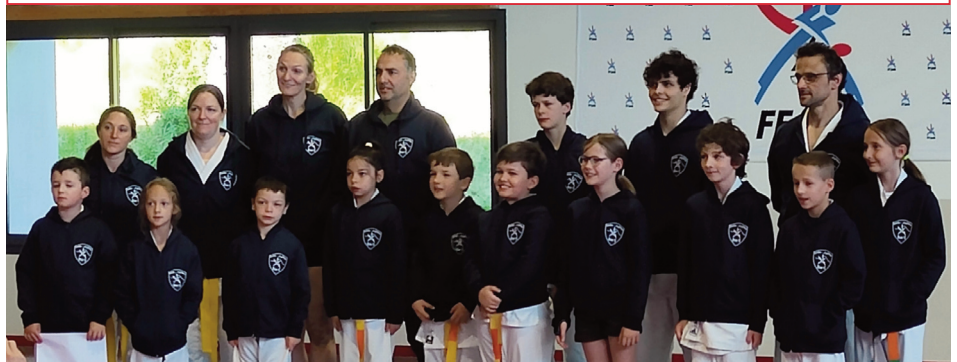
La reprise approche pour le club de judo.

Les cours de judo reprendront en septembre selon les horaires suivants. Les lundis de 18 heures à 19h30 se tiendront les cours de renforcement musculaire. Les mercredis, deux cours seront proposés. Un cours de Taïso de 19 heures à 20h30 et un cours de judo de 20h30 à 22 heures. Les vendredis de 19h15 à 20h30, des cours de judo seront aussi dispen-