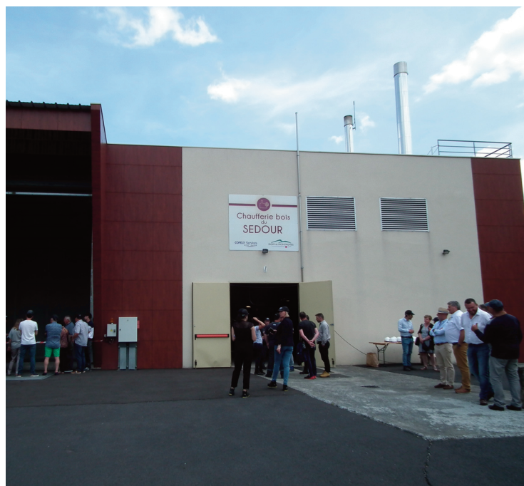
Sortie de terre en 2013, la chaufferie a déjà un bon bilan après 10 ans de fonctionnement.