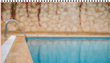
La construction de piscine nécessite des déclarations.

Pour toute construction de piscine (même hors sol), véranda, garage, abri de jardin, terrasse ou extension d'habitation, des autorisations telles que déclarations préalables ou permis de construire peuvent être nécessaires. Chaque situation étant différente, ne pas hésiter à se renseigner auprès du service urbanisme de la mairie de Riom-ès-Montagnes. Selon le code de l'urbanisme, lorsque la construction a été réalisée sans avoir ob-