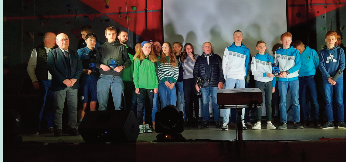
L'OMJS a notamment organisé les Trophées Sportifs en janvier dernier.

Le club comptant le plus de licenciés et notamment le plus de jeunes est l'ORCR, avec 167 licenciés dont 108 jeunes. Viennent ensuite l'Entente Stade Riomais Condat, avec 132 li-