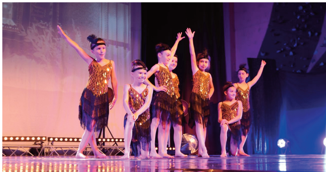
L'association R'Dance présentera son gala de fin d'année les 9 et 10 juin prochain au gymnase.

À travers des chorégraphies qu'ils travaillent depuis le début de l'année, les spectateurs pourront ainsi apprécier d'un œil différent leur collection d'œuvres variées. Sur des musiques de Rihanna, Aretha Franklin ou même encore Daft Punk, peintures, sculptures, inventions et civilisations anciennes s'animeront sous vos