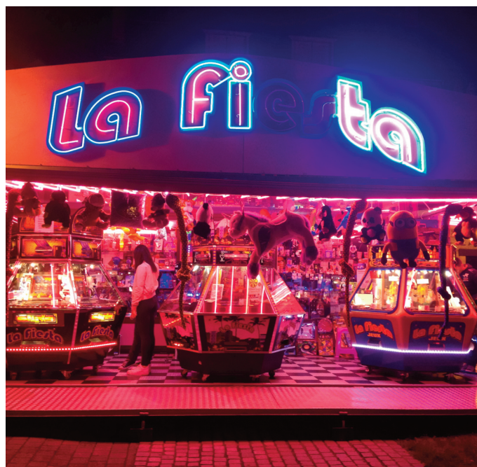
Les attractions foraines seront de retour dans les rues de la ville, durant deux jours.

Les petits-déjeuners à réserver À 16 heures, les enfants se régale-