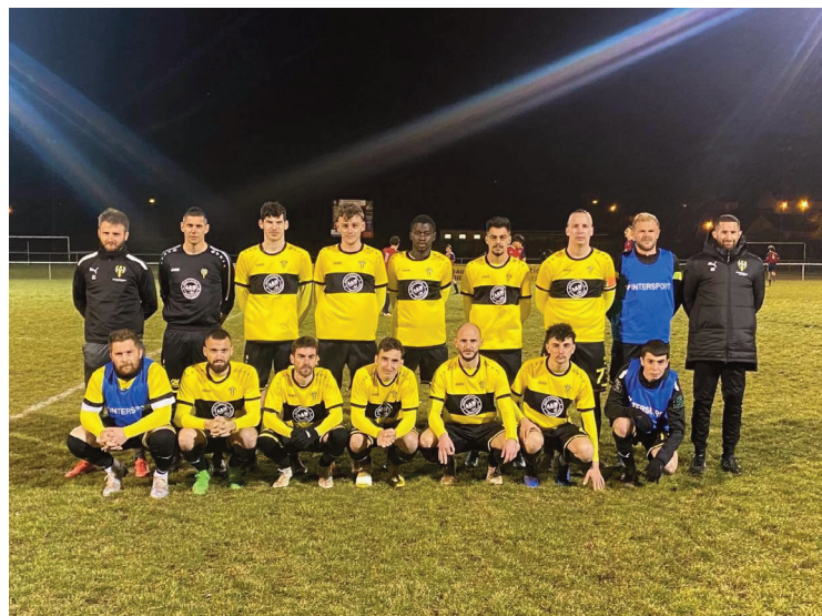
Créé en 1933, le club soufflera ses 90 bougies samedi 24 juin.

L'après-midi, les festivités débuteront pour les enfants avec l'installation de jeux gonflables dès 14h30 au stade, et se poursuivront par un match des vétérans à 18 heures. La soirée se déroulera ensuite au gymnase, avec, à partir de 19h30, une exposition photos, un repas dansant animé par Maxximum. Au menu : salade auvergnate, jambon braisé, gratin dauphinois, fromage et crumble de pommes. Tarif : 20 €. Un menu enfant sera également proposé à 12 €, avec