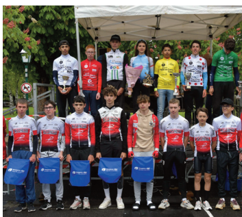
De nombreux jeunes coureurs ont participé.

Samedi 13 mai dernier, l'Union Cycliste de Riom-ès-Montagnes (UCRM), avec l'aide du Comité Départemental de Cyclisme, a organisé la 3e Étape du Tour du Cantal Cadets entre Ydes et Riom-ès-Montagnes, soit une étape de 70 km. 80 coureurs venant des régions Auvergne Rhône Alpes, Occitanie, Provence Alpes Côte d'Azur, Nouvelle Aquitaine et Pays de la Loire ont pris le départ