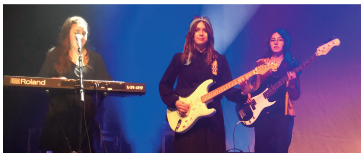
Des groupes d'élèves de l'école de musique se produiront pour la fête de la musique.

Après la fête patronale, c'est la musique qui sera célébrée à Riom, mercredi 21 juin. Organisée par l'École de musique du Haut Cantal, conjointement avec l'Office municipal des animations et des fêtes (OMAF), celle-ci promet déjà un beau programme, entre concerts des élèves, orchestre et groupe de musique actuelle. La soirée débutera à 18h45 sur la place de la mairie, avec di-