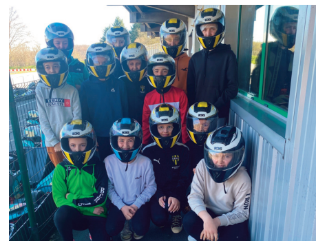
À Pâques, les ados sont allés faire du karting.

L'accueil de loisirs sera ouvert du 10 juillet au