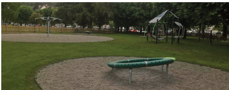
Six nouveaux jeux feront le bonheur des enfants.

L'extension de l'aire de jeux du Coudert est désormais ouverte après plusieurs mois de travaux. Avec les beaux jours, les familles et notamment les enfants pourront désormais profiter de six nouveaux jeux, implantés à