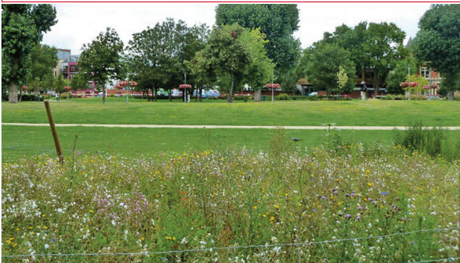
La municipalité va appliquer la gestion différenciée, qui consiste à laisser pousser une partie des espaces verts.

Préconisée par la FREDON, la municipalité de Riom-ès-Montagnes va mettre en œuvre la gestion différenciée de ses espaces verts. Qu'est ce que cela signifie exactement ? On vous explique.