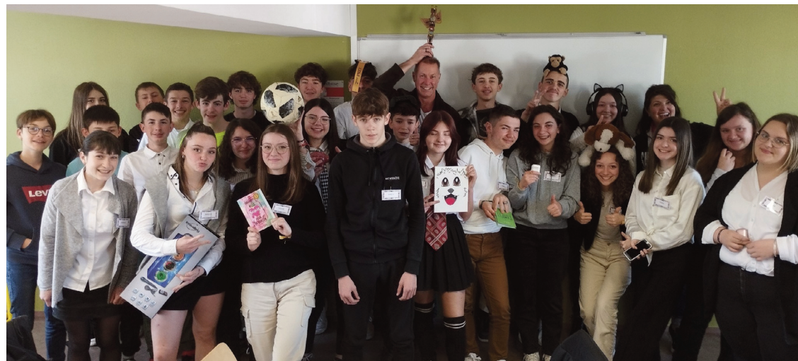
Les élèves se sont immergés dans la culture anglaise pendant plus d'une semaine.

Parmi les partenaires, figure l'association "Théâtre en anglais" à l'initiative de la création de la pièce de théâtre "Tired of giving in : The Rosa Parks story" vue par les