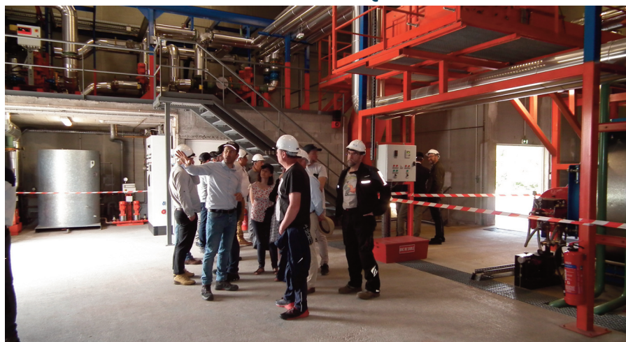
Plus propre et durable, l'énergie générée par la chaufferie évite l'émission de gaz à effet de serre.

Long de 2,5 km, le réseau de chaleur bois de Riom présente de multiples avantages, tant sur le plan économique que sur celui de la transition énergétique et du développement durable. Depuis 10 ans, la chaufferie a livré 41 630 MWh, soit 4 163 MWh par an, ce qui équivaut à 5 000 000 litres de fioul économisés. Ce mode de chauffage, plus « propre » rejette également moins de gaz à effet de serre. Ainsi, depuis 2013, la chaufferie a