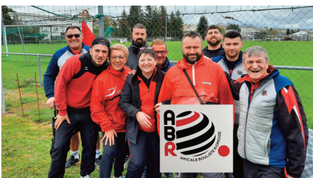
Les boulistes rimois ont décroché de beaux résultats.

Dimanche 7 mai s'est tenu à St Chély d'Apcher le Championnat départemental en doublettes de boules lyonnaises. Malgré une météo exécrable, les équipes Riomoises de l'Amicale